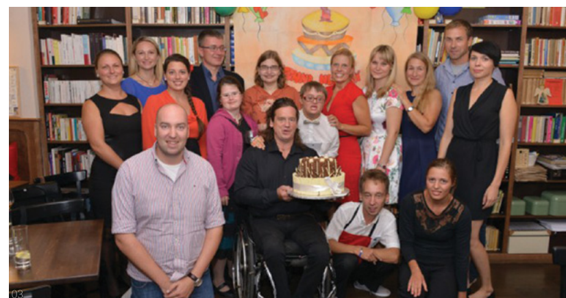
03 Kavárna AdAstra slaví narozeniny

SPOLEČNĚ / N°1/2017, říjen 2016 – leden 2017